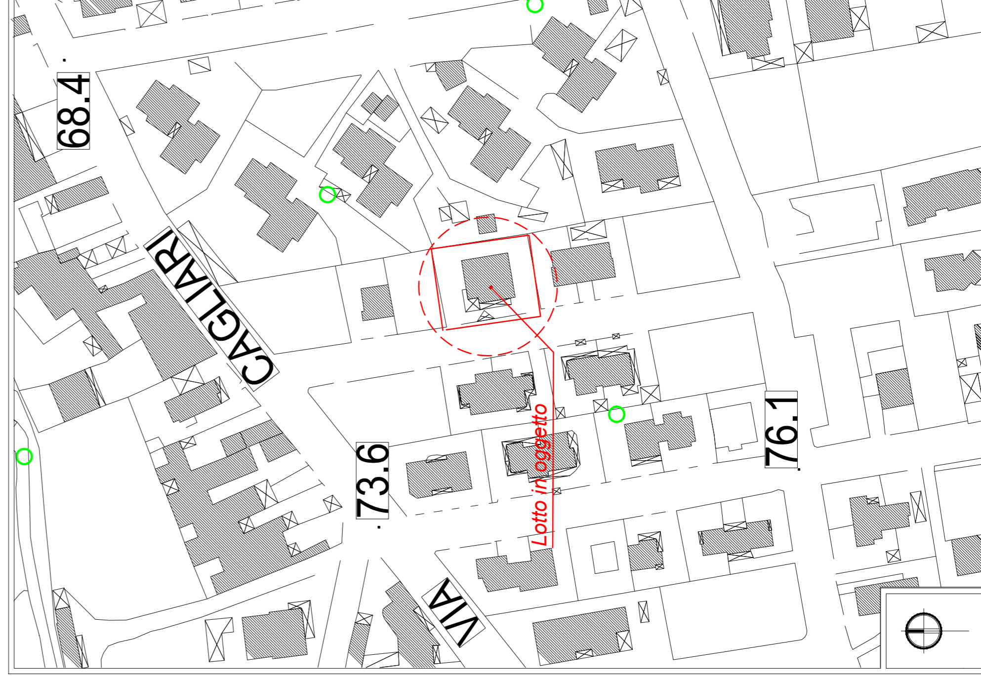
STRALCIO CTR SCALA 1:1000