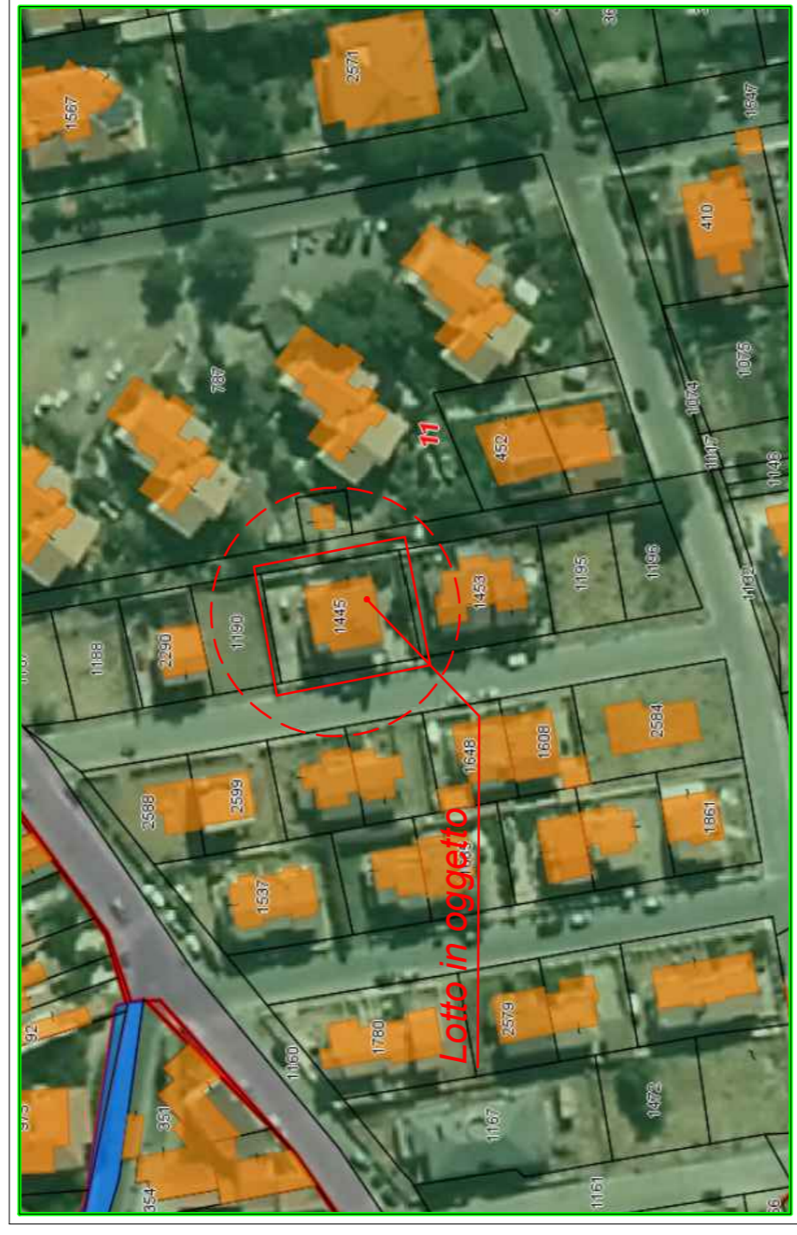
STRALCIO PLANIMETRIA CATASTALE SIT Foglio 11 - Mappale 1445